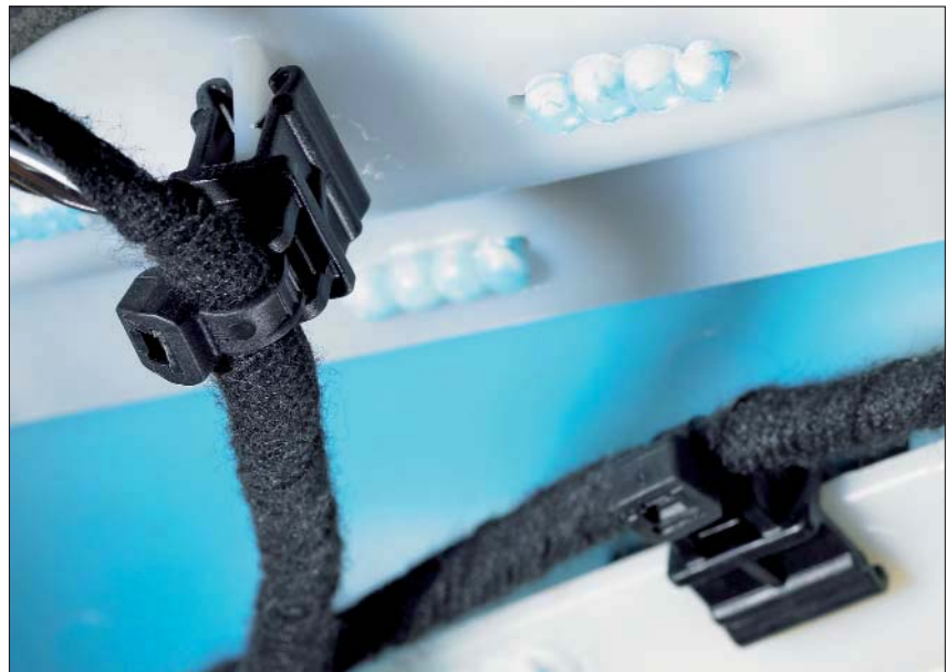
T50ROSEC10 auf eine Kunststoffkante gesteckt.

Die Kombination aus EdgeClip und Kabelbinder ist eine sehr gute Alternative überall dort, wo Lochbohrungen nicht akzeptabel und Kleber aufgrund höherer Temperaturen nicht einsetzbar sind. Anwendung findet die EdgeClip-Family zur Bündelung und Befestigung von Kabelbäumen und Schläuchen in der Elektroindustrie, im Schaltschrankbau und in der Automobilindustrie.