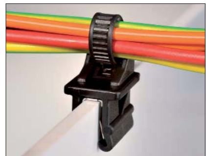
Der einteilige Befestigungsbinder T50ROSEC12 kann einfach auf Kanten aufgedrückt werden.