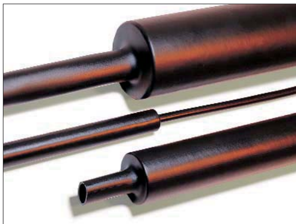
MA47 und MU47 - mittelwandig mit und ohne Innenkleber.

Schutz von Kabeln und Leitungen bei höheren mechanischen Beanspruchungen, z. B. auf und unter der Erde. Zugentlastung für Kabel-Stecker-Übergänge und Isolation von elektronischen Bauteilen und Spleißen.